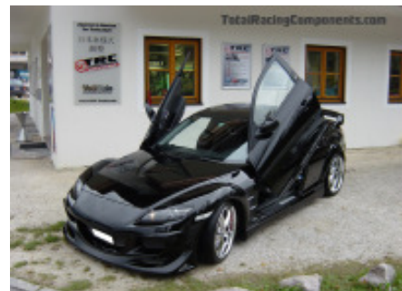
Ici ma voiture préférée la Mazda Rx8